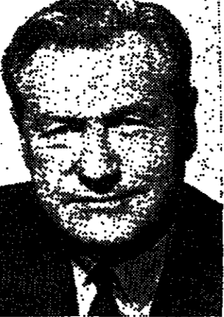
روكفلر يحذر حكومة اميركا

ما لا شك فيه ان بعض المجرمين يستحقون السجن وما هو اكثر من السجن لان تقاضم خارج جدرانهم يشكل خطرا على المجتمع والوطنين. كبر تلكه فئة اخرى من المجرمين او الاجناب الذين اقتربوا جرائمهم بدافع انفعالات نفسية آتية، او بسبب هوة او ظن، او من جراء معاشرتهم زفان السوء، ثم ما لبثوا ان عادوا الى رشدهم ونحووا على ما جنته ايديهم وسماوا الى السجن. من ذلك بصرافهم الحسنة في السجن. وعلى هذا الاساس اقر مجلس العموم البريطاني في نيسان «ابريل» من هذا العام بعض التعديلات في قانون الجزاء اتاح بسبويه الاجرام عن بعض فئات السجين خارج الحبس، ومواطني سنجلت هؤلاء تحت اشراف مراقب مسؤول يسهر على تصرفاتهم ويراقب سلوكهم، فاذا ارتكبوا جرما ما جازت عليهم في جديد وتنفذ بقضيتهم العقوبة التي يتلونها جزاء لتقاضيهم ضحايا اليها اذلة التي سبق لهم واعفوا منها. ٥٥٥٥ يفتشون